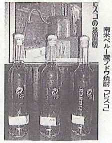
アルゼンチン産のワイン

リンククは、日本の食糧確保と南米の農業振興を目的として、アルゼンチンを中心に南米各地で視察ツアーを実施している。このツアーでは、現地での視察だけでなく、現地との交流を通じて、日本の農業と南米の農業とのつながりを深めようとする取り組みの一環として行われている。